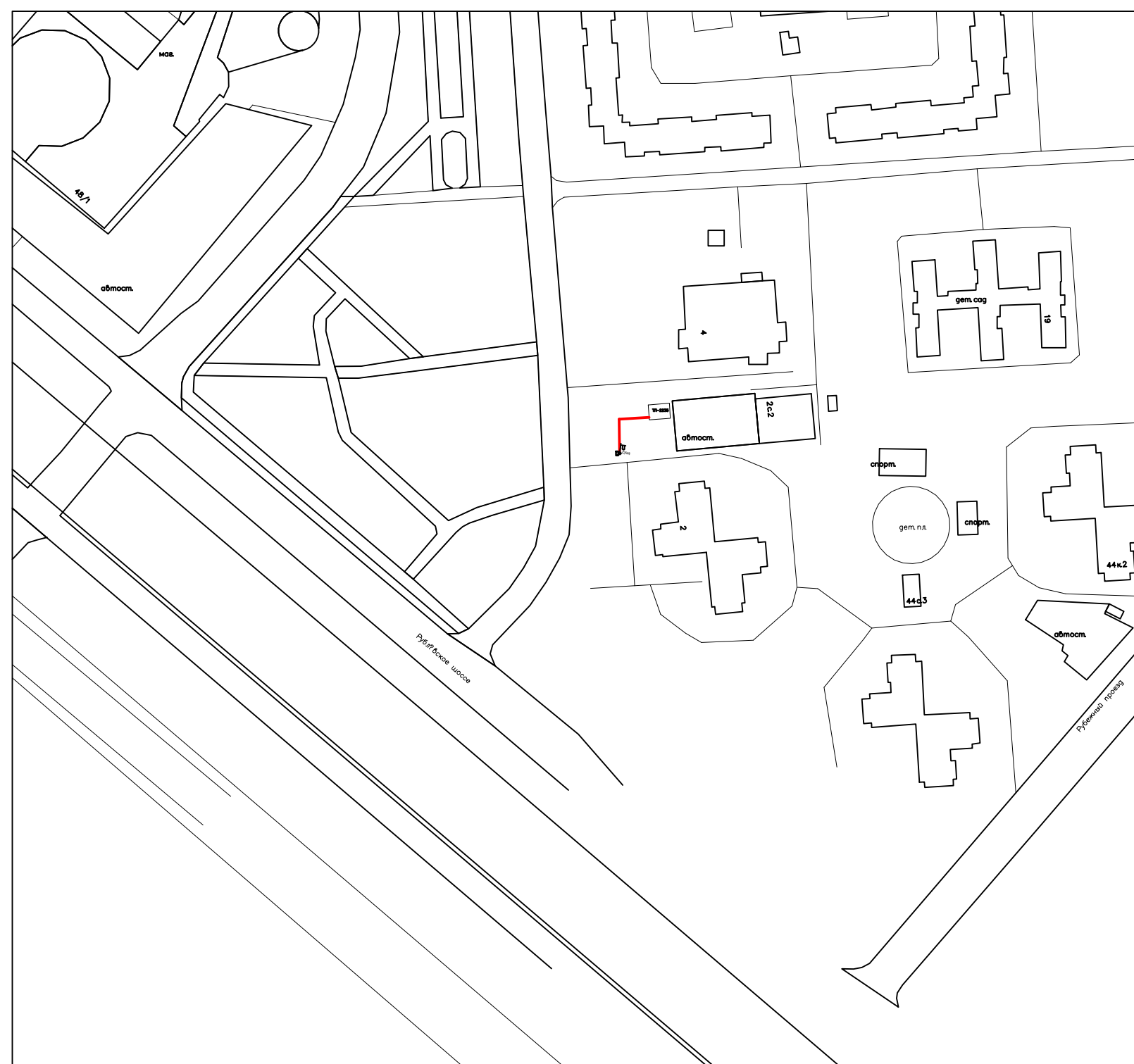
Ситуационный план М 1:2000